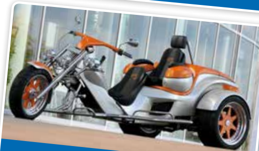
Highlight am Rolli Power Day: Das behindertengerechte Rewaco Trike