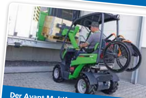
Der Avant Multifunktionslader