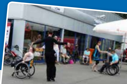
Die Rolli Tänzer aus Krefeld