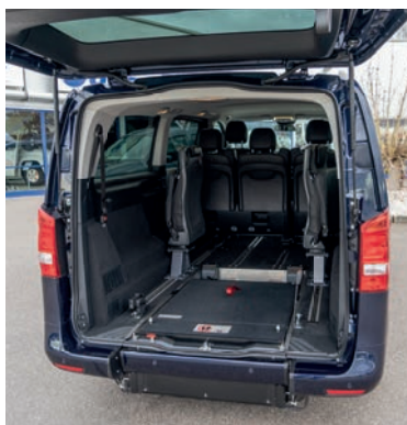
Die eingeklappte EASYFLEX Rampe ermöglicht die volle Nutzung des Kofferraums.