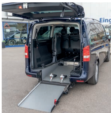
Bei ausgeklappter Rampe lässt sich das Fahrzeug bequem mit dem Rollstuhl befahren.