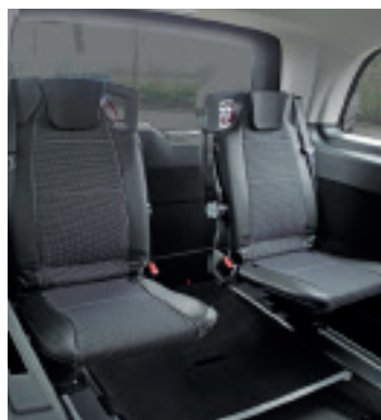
Optionale Dreh-Klappsitze in dritter Reihe ermöglichen eine flexible Nutzung des Fahrzeuges.